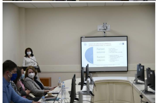
Susținerea proiectelor finale în cadrul programului de formare continuă MHELM, 9 martie 2022