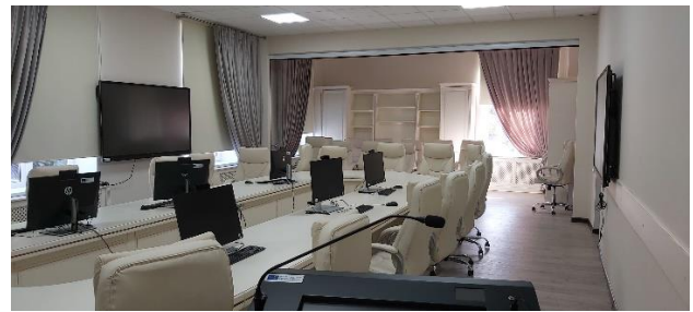
Sala de studii și întruniri dotată cu echipament în cadrul proiectului MHELM (suma totală a echipamentului 33135,00 EUR)